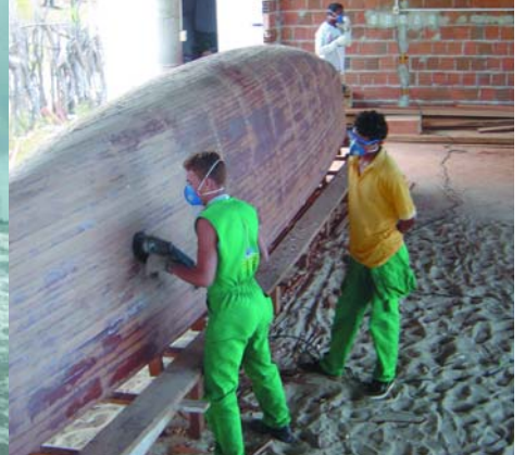
Schleifarbeiten an einem der beiden typischen Seitenrümpfe des Katamaran