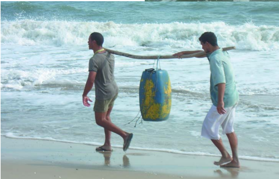
Trinkwasser für eine mehrere Tage dauernde Ausfahrt