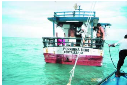
Prainhafischer auf der Jagd nach Taucherpiraten

scher. Zwei Arbeitspapiere, die an der FAO Fischereikonferenz Anfangs März 05 in Rom diskutiert wurden, widmeten sich dem Problem des Überfischens und der Armutsbekämpfung.