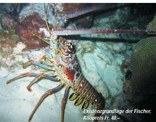
Existenzgrundlage der Fischer, Kilopreis Fr. 40.-