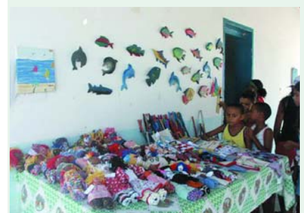
Verkauf von Handarbeiten an der Eltern/Schulkonferenz

Einige der Arbeiten bringen die Kinder nach Hause, andere kommen in den Verkauf und tragen dazu bei, das Projekt zu finanzieren. Die Kinder machen mit grosser Begeisterung mit und schaffen erstaunliche Kunstwerke. Dieses Vereinsprojekt 22 wird einigen Jugendlichen Türen öffnen. Im Übrigen wird es sich mit der Zeit selber finanzieren und dürfte von anderen Fischerdörfern kopiert werden.