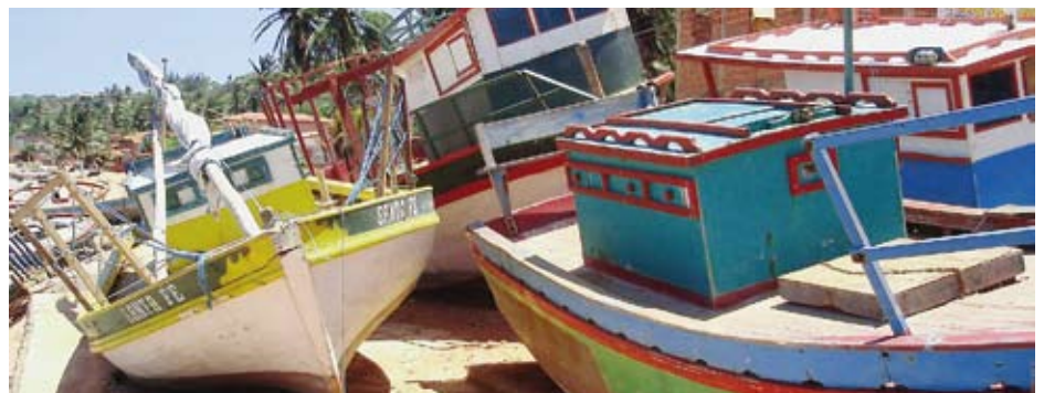
Am Strand von Redonda sind einige der illegalen, durch die Bürgermiliz gekaperten Schiffe, ausgestellt.

Die frustrierten Fischer in Redonda übten Selbstjustiz, indem sie 15 Boote der Wilderer gekapert und einige versenkt resp. in Brand gesteckt haben. Die Lokalbehörden und die Marine sind inzwischen aktiv geworden und patrouillieren im Konfliktgebiet. Die illegalen Fischer sind auf andere Küstengebiete, wie z.B. Prainha do Canto Verde ausgewichen.