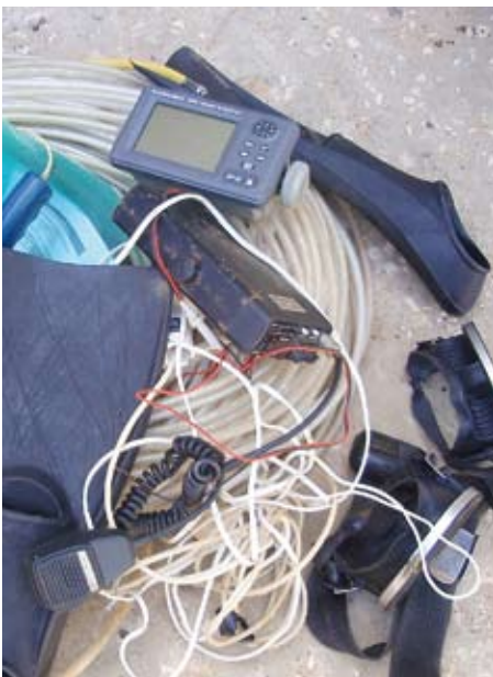
Verbotenes Tauchmaterial der Wilderer: Schlauch, Maske, Flosse, GPS, Mobiltelefon

Wenn die Regierung versagt, greifen die einheimischen Fischer in Redonda (Município Icapuí) zum Notrecht und bekämpfen die Frevlerfischer.